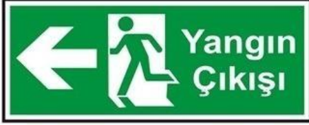
Yangın çıkışı levhası

» Tabela, levha ve levha niteliğindeki yazılarda geçen kelimeler büyük harfle başlar.